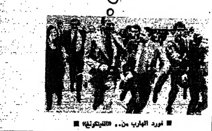
نور الهارب من... «البيوت»